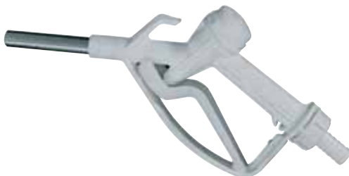
Manual nozzle available Code: F14761000