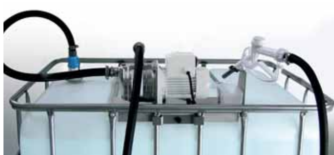
Suzzara Blue IBC without meter - Horizontal version